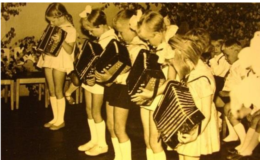
Vana aasta pidu (Maamägi, 1966)