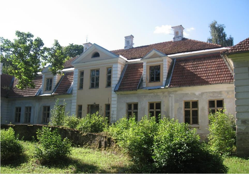
Joonis 2. Kodasoo mõis (Tammik, 2009)