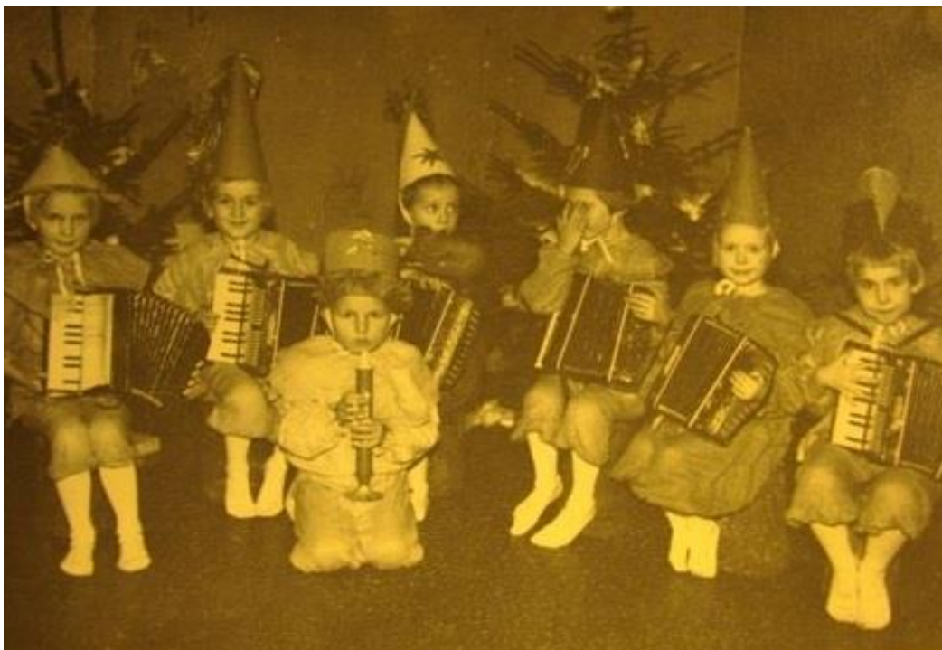
Oktoobri pidu (Kaasik, 2011)